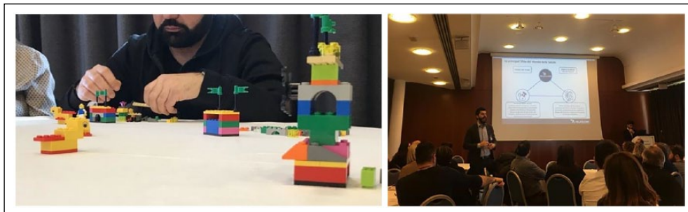
Figura 3. Alcuni momenti del laboratorio “Think & FaBrick” con LEGO Serious Play.