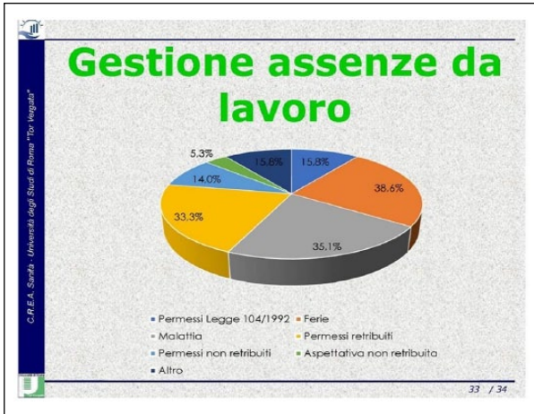
Figura 6.

potrebbe migliorare la loro qualità di vita in modo rilevante (punteggio 8-10 in una scala da 0 a 10).