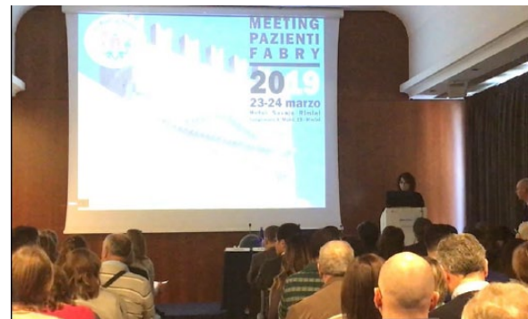
Figura 1. L’apertura del Meeting Nazionale Pazienti Anderson-Fabry.

Particolarmente toccante “ Think e FaBrick ” (l’attività a gruppi guidata da Helaglobe nella mattinata di domenica) che, utilizzando il ‘LEGO serious play’ (un metodo