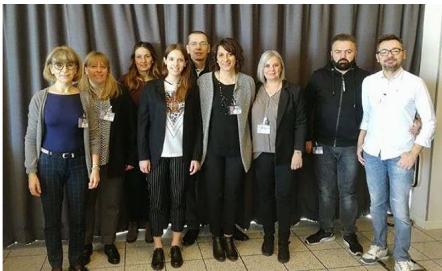
Figura 4. Il nuovo Organo di Amministrazione di AIAF Onlus eletto dall'Assemblea.

individuale li ha aiutati ad identificare anche a quali risorse attingere e quale sia il primo passo da compiere subito, a partire da oggi, per avviare il percorso che li porterà a vincere la loro personalissima sfida.