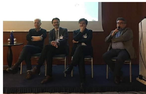
Figura 2. Alcuni medici del Comitato Scientifico di AIAF nel corso della Tavola Rotonda.

finalizzato a sviluppare il pensiero, la comunicazione e la risoluzione di problemi attraverso l’impiego dei famosi mattoncini LEGO) ha permesso di confrontarsi con le proprie e le altrui emozioni (figura 3). In questa occasione, i pazienti non si sono solo conosciuti e divertiti, ma hanno soprattutto individuato e condiviso quali sfide, barriere e ancora emotive devono affrontare ogni giorno. In primis come persone, e poi come pazienti. L’analisi interiore ed